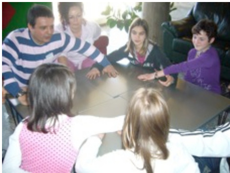
Un jeu avant le choix des délégués Choix des activités du camp !