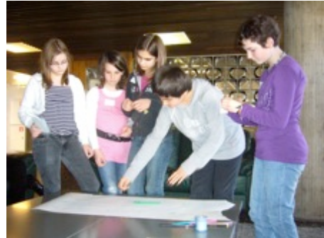
On vote les activités du futur camp