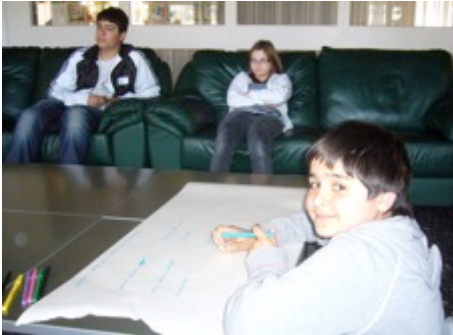
Secrétaire de la rencontre

Par une magnifique journée de printemps, 5 délégués de la suisse romande se sont retrouvés à Lausanne. Temps de connaissance des uns des autres, de préparation du camp et le choix des 3 délégués qui y participeront.